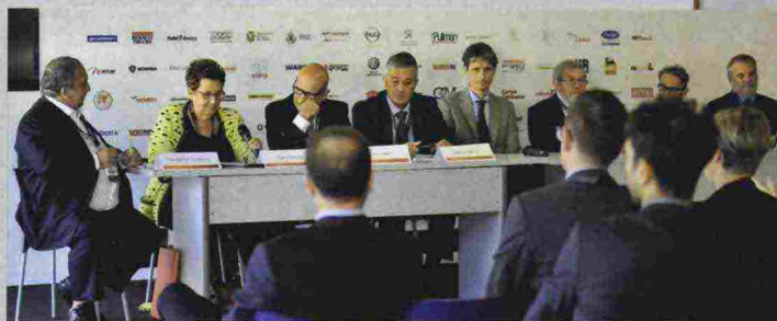
Uno dei convegni centrali dell'ultima edizione di truckEmotion è stato quello legato al trasporto di alimenti, da cui poi è nata l'iniziativa Oita (vedi pagina 42).

Domenica 16 ottobre. Gli organizzatori hanno (finalmente) dedicato l'attenzione che merita al conto proprio (10.00-13.00), spesso ingiustamente ignorato ma strategico specie nel segmento della distribuzione. Numerosi gli interventi previsti, specie nell'ambito del risparmio e dell'ottimizzazione.