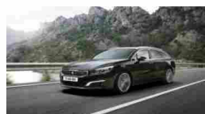
Nuova Peugeot 508 SW MIX, performante, comoda e rispettosa dell'ambiente