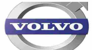
Nuovo Volvo FH con cabina a tetto ribassato: elevata potenza in spazi ristretti