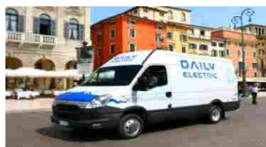
Iveco presenta il nuovo Daily Electric a Ecomondo 2015