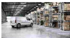
Nuovo Peugeot Expert: arriva sul mercato italiano con soluzioni inedite