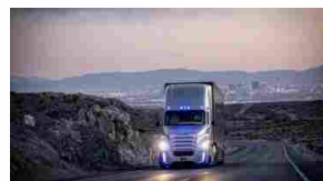
Freightliner Inspiration Truck: una world première da Guinness World Records™