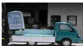
Piaggio veicoli commerciali: presentata la nuova gamma Porter 2016