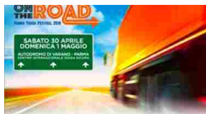
On The Road Parma Truck Festival, un progetto di formazione unico in Italia