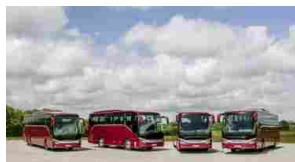
Setra 500, la nuova gamma di pullman