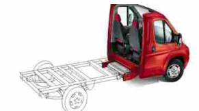
Fiat Professional sarà presente al Salone del Camper 2014 di Düsseldorf