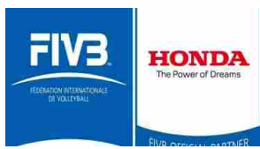
Honda: fino al 2016 "Official car" della Fédération Internationale de Volleyball (FIVB)