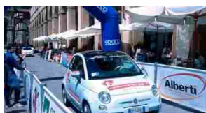
Grande attesa per il 10° Trofeo Eco Rally San Marino- Città del Vaticano (15/17 Maggio 2015)