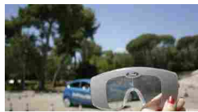
Ford Driving Skills For Life 2015 giunge a Padova, per la seconda tappa del tour