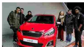
108 X FACTOR, Fondazione ANT: sostegno per il progetto Bimbi