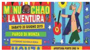
Autodromo Nazionale Monza: Manu Chao in concerto (Sabato 20 Giugno 2015)