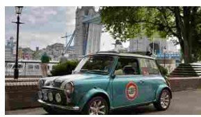
International Mini Meeting 2014: il più grande raduno mondiale di Mini classiche