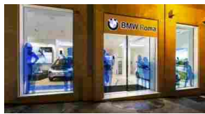
"Incontro con l'Arte", la mostra sarà inaugurata il 23 settembre da BMW Roma