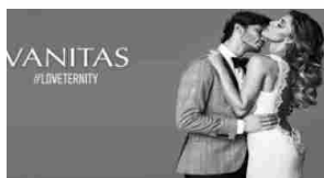
Planet Stand Creation: a lavoro tra Futuro Remoto e Tutto Sposi