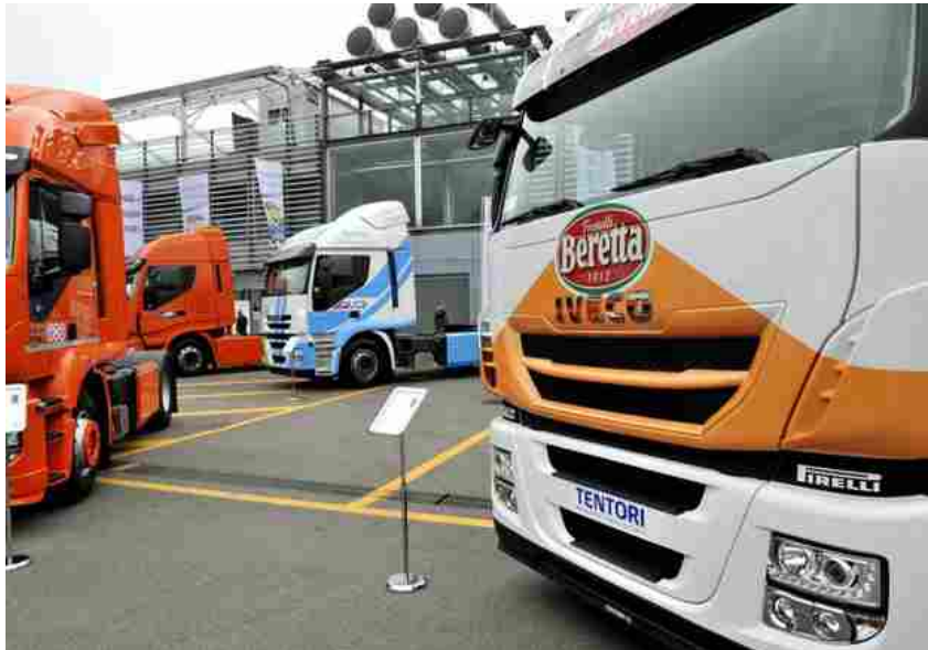
Food'n'Motion, l'evento dedicato al trasporto alimentare

Redazione ANSA ROMA 09 SETTEMBRE 2015 17:56