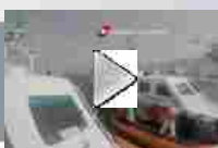
Canale di Sicilia, immigrati salvati dalla Guardia Costiera