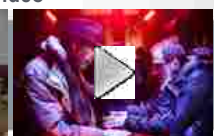
Venezia Cinema: 'Non essere cattivo' di Claudio Caligari fuori concorso