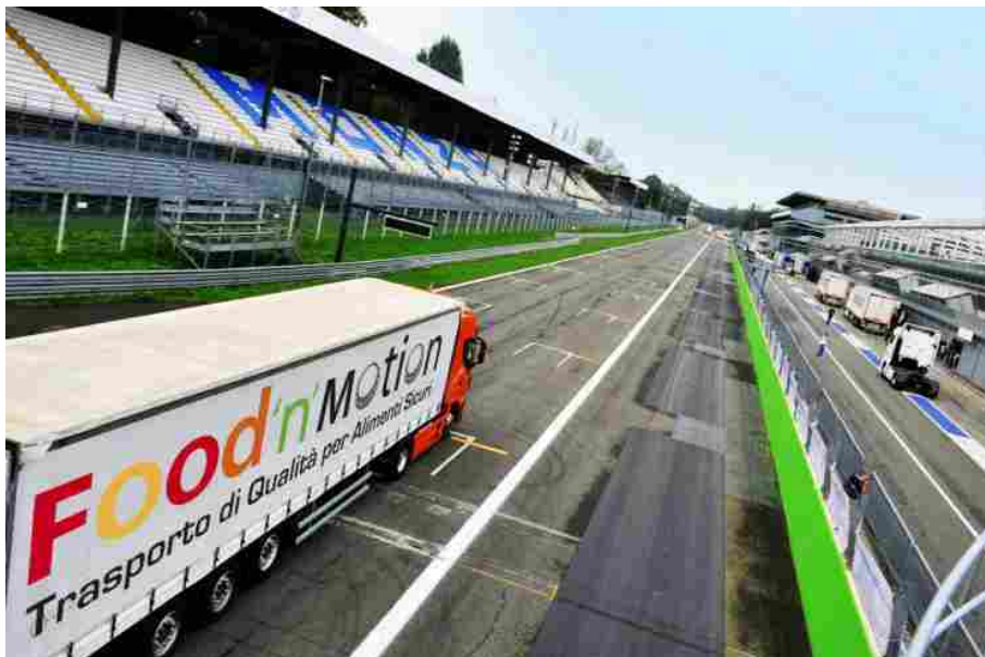
Food'n'Motion: Trasporto di qualità per alimenti sicuri

Food'n'Motion – Introdotta dall' Associazione Noi Camionisti , si è svolta in questi giorni a Expo 2015 la presentazione di Food'n'Motion , l'evento novità che arricchisce la quarta edizione di truckEmotion & vanEmotion , la manifestazione nazionale dedicata al mondo dei veicoli industriali e commerciali da trasporto e da lavoro, in programma all' Autodromo di Monza da venerdì 25 a domenica 27 settembre con ingresso libero .