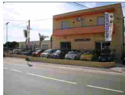
Nuovo e Usato Arrivi settimanali